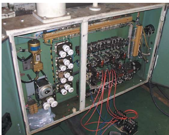
研削盤用接点リレー制御装置

古い工作機械でも、機械間のワーク搬送を自動化すれば、作業員の負担軽減・スピードアップが可能です。三宝精機工業が経験と技術を活かして機械、システムをコーディネートします。