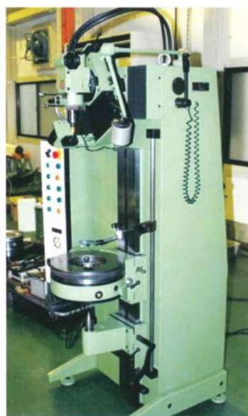
FISCHER(フィッシャー社)センター穴研削盤ZSM-1000型 スイス製

主仕様:1-1000mm×φ140mm(最大) 据付面積:W1000mm×D900mm×H2000mm 砥石寸法:コレットチャック径φ6mm/砥石最大径φ12mm