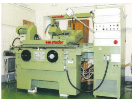
STUDER(スチューダー社) 汎用円筒研削盤S20-2型 スイス製

主仕様: 様心間600mm×100mm 据付面積:W2200mm×D1600mm×H1800mm 砥石寸法:外径φ350mm×内径φ127mm×t32mm×t50mm